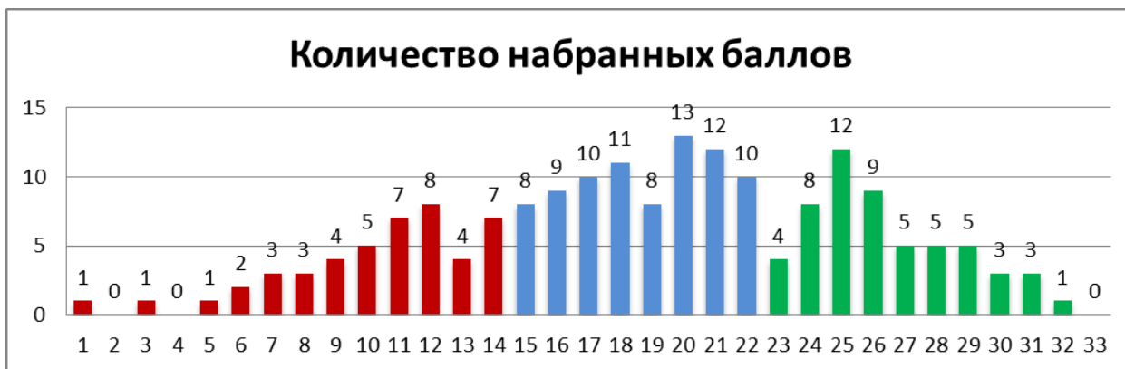
Рисунок 1 Количество набранных баллов

Красный цвет – диапазон от 0 до 14 баллов: 46 девятиклассников (25%) не достигли минимального порога, чтобы получить положительную отметку. Синий цвет – диапазон от 15 до 22 баллов, соответствующий отметке «3» (84 учащихся – 46%). Зелёный цвет – диапазон от 23 до 32 баллов, соответствующий отметкам «4» и «5» (при наличии достаточного количества баллов за грамотность).