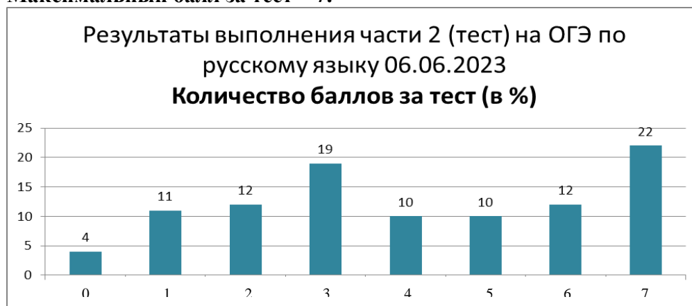
Рис. 2 Выполнение тестовых заданий

На рис. 2 представлены результаты по количеству набранных за тестовые задания баллов. 13 девятиклассников (4%) не справились с тестом (0 баллов). Максимальный балл 7 лишь у 58 участников экзамена (22%, как и в прошлом году). Ещё у 31 (12%) – по 6 баллов за тестовую часть экзаменационной работы. Понятно, что данные результаты не показывают объективной картины усвоения лингвистических знаний выпускниками основной школы. Но всё-таки необходимо с 5 класса использовать на уроках приёмы