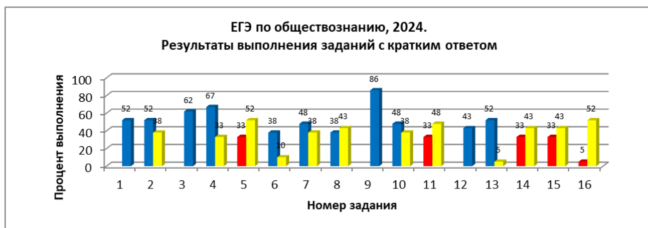
Рис. 1. Выполнение заданий с кратким ответом.

Выполнение заданий с кратким ответом представлено на рис. 1.